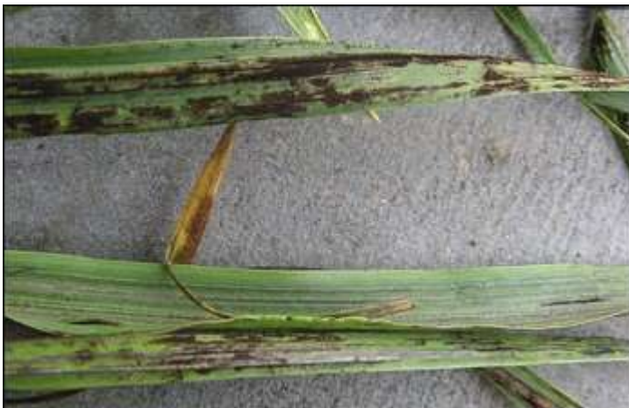
Зовнішній вигляд захворювання