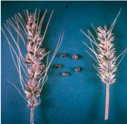
Зовнішній вигляд захворювання