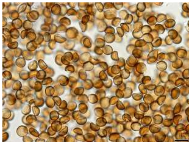
Збудник Ustilago tritici