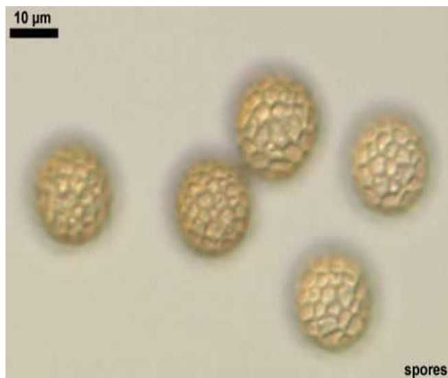
Збудник Tilletia caries