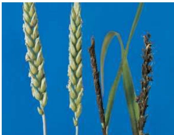
Зовнішній вигляд захворювання