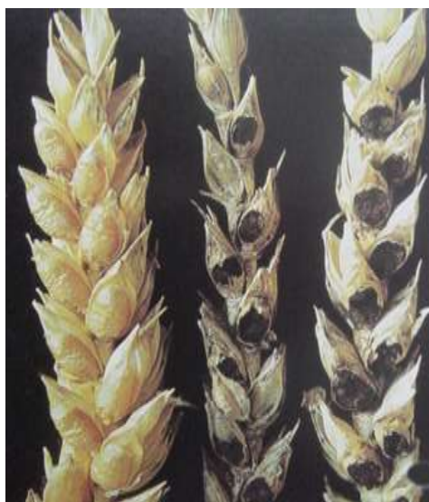
Зовнішній вигляд захворювання